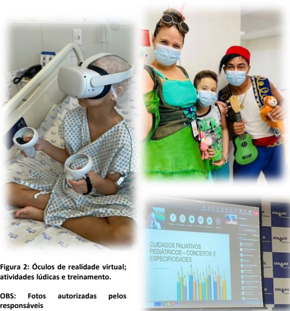
Figura 2: Óculos de realidade virtual; atividades lúdicas e treinamento.

OBS: Fotos autorizadas pelos responsáveis