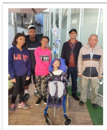
Figura 2. Família participante do projeto.

Os relatos dos participantes destacaram a melhora no humor e a redução do estresse e da ansiedade, além da importância dos pequenos detalhes para que o encontro ocorresse, como o transporte ofertado, a qualidade do café e a decoração do ambiente. Um participante mencionou que nunca havia desfrutado de um momento tão especial e acolhedor mesmo em casa e ressaltou que a presença dos irmãos foi muito importante para ele.