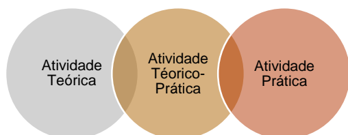
Figura 1: Atividades dos residentes nas 60horas/semanais

A experiência foi vivenciada por farmacêuticos preceptores e residentes do primeiro e segundo ano da Residência, no período de março a dezembro de 2021, em um Centro de Oncologia.