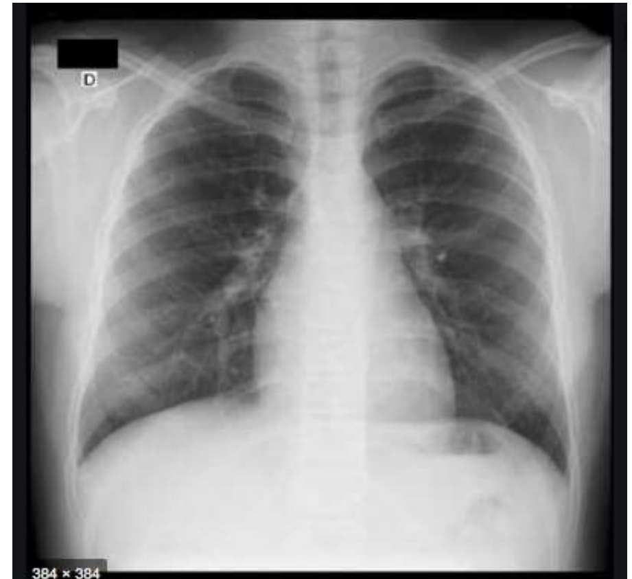
384 x 384